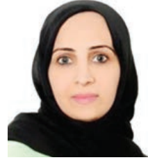
د. جلييلة السيد جواد.

أكدت الدكتورة جلييلة السيد جواد الرئيس التنفيذي لمراكز الرعاية الصحية الأولية أنه تم فتح باب التسجيل للجمهور الكريم لاختيار طبيب العائلة في جميع المراكز الصحية بمحافظة المحرق، وذلك عبر الموقع الإلكتروني www.phc.gov.bh ، حيث تأتي هذه الخطوة في إطار تعزيز الجهود المبذولة لتطوير الخدمات الصحية وفق مفهوم طب العائلة.